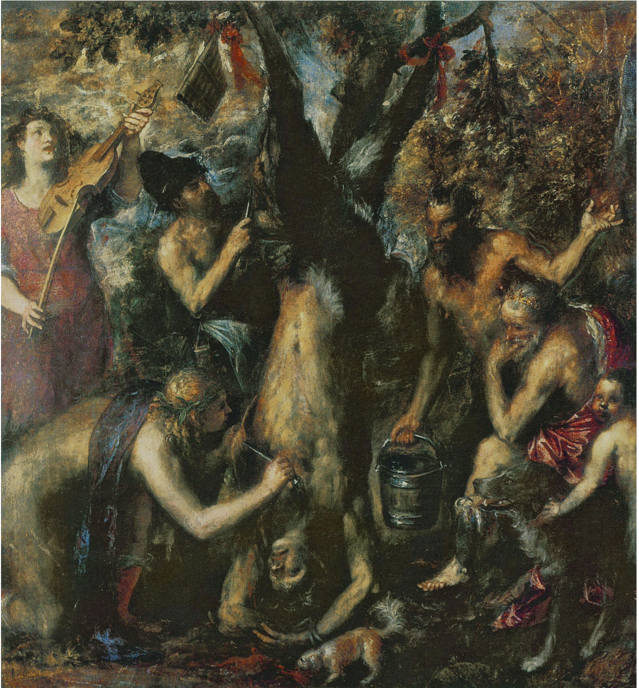
Fig. 9: Tizian: Die Schindung des Marsyas (Allegorie der Bartolomäusnacht), um 1572-76. Kremsier/CZ, Erzbischöfliches Schloss

Gesprächsprogrammes) v.a. heute angestellt werden: ein weinliebender, betrunkenener, aber stark übergewichtiger Silen und gleichzeitig weiser Sokrates mit alkibiadeshaft schöner Seele als allenfalls ironisches Krypto- oder Identifikationsporträt ohne irgendeine äussere Ähnlichkeit mit dem attraktiven, ca. 48jährigen hofmännischen Rubens (S. Alpers) macht eigentlich höchstens Sinn, weil die bald darauf (1626) an der Pest verstorbene erste Gemahlin Isabella Brant und