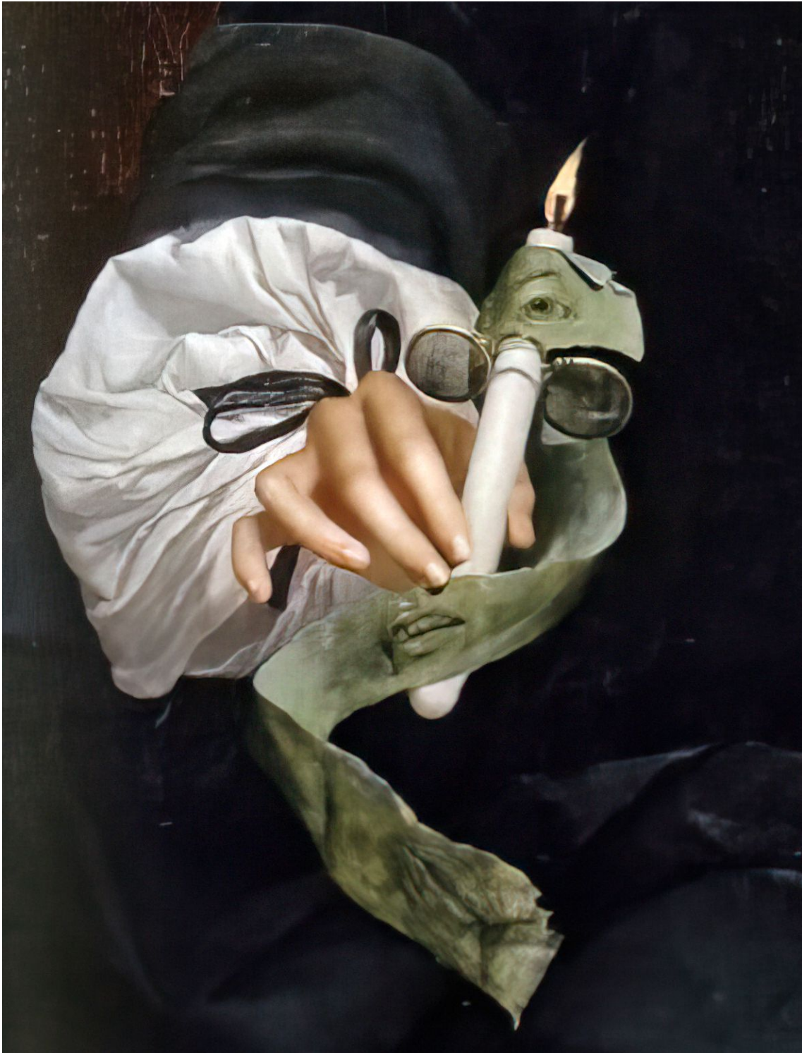
Fig. 14: Jan van Wijckersloot (zugeschr.): Selbstbildnis, 1669, Detail. Leipzig, Museum der bildenden Künste (Foto: Wikimedia bearbeitet)

ein: der geruchsvortäuschend stinkende närrische „Schafskopf als allegorisches Spiegelbild des selbst närrischen Malers“. Aber was, wenn dieser Maler im seitlichen Blick ausser zum Betrachter mehr auf den ins Bild ziehenden beissenden, ihm in die Nase stechenden Rauch eines auf der Ablage liegenden ‚Glimmstengels‘ reagiert, oder statt einer „scharfzüngigen“ (S. 357) sinnlosen