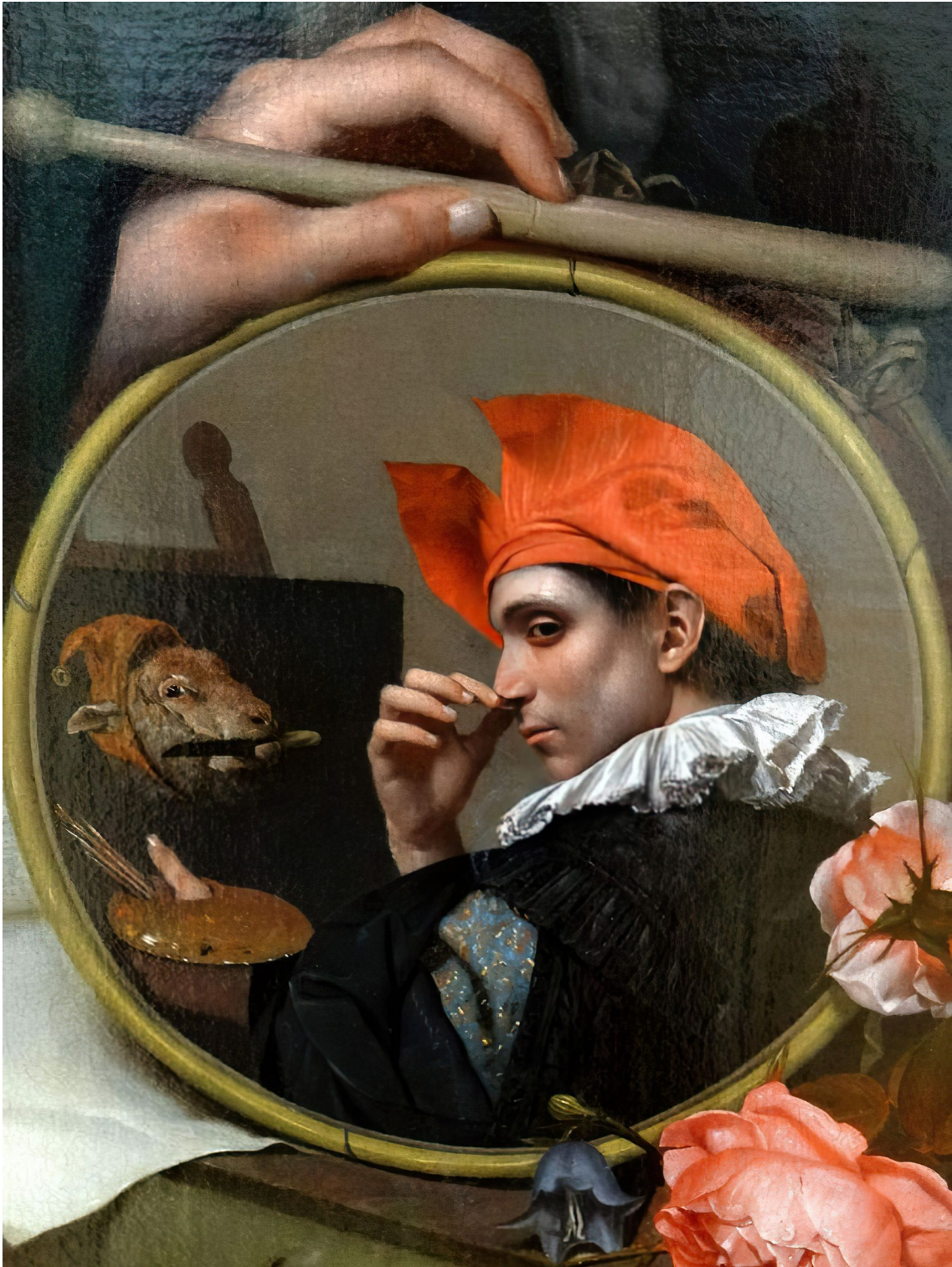
Fig. 13: Jan van Wijkersloot (zugeschr.): Selbstbildnis, 1669, Detail. Leipzig, Museum der bildenden Künste

Narrenkappe und Messer im Maul fallen dem Autor natürlich gleich Leonardos und Caravaggios Sezierungen und Niklas Luhmanns Naiv-Raster (,Beobachtung zweiter Ordnung‘ und gar dritter?)