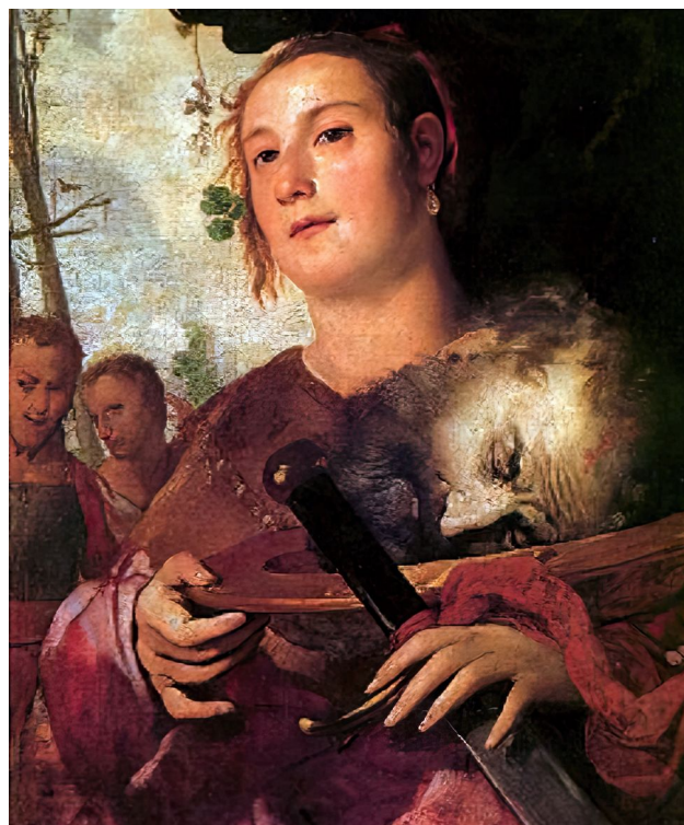
Fig. 1: Francesco Maffei (zugeschr.): Judith, um 1650. Faenza, Pinacoteca

Als Beispiel eines selbstreflexiven ‚Kunstbildes‘ vor dem Zeitalter des ‚Kultes‘ wird im Einleitungskapitel eine griechische rotfigurige Symposions-Trinkschale (Kylix) des Erzgiesserei-Malers herangezogen. Statt von Skulpturen sollte man wenigstens etwas mehr produktionsästhetisch deshalb durchgehend von Metall-Giess-Treifarbeiten oder Plastiken sprechen. Die „Musterblätter“ (aus Pergament, Papyrus?) an der Wand dürften eher Reliefs wiedergeben. Das Schaleninnere ist dem Patron der Erzgiesser, Hephaistos, gewidmet, der möglicherweise die Rüstung für Achill an Thetis übergibt, ohne dass aber einer Visualisierung einer Ekphrasis gleich der homerische Schild-Dekor eine Wiedergabe (Harpye und vier Ornamente) erfährt.