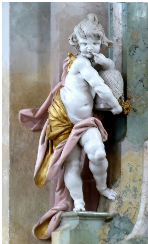
Fig. 16: Joseph Anton Feuchtmayer: Der Honigschlecker, 1748-1758. Birnau, Wallfahrtskirche

Es gibt einige nicht nur semantisch, sondern v.a. künstlerisch bereichernde, vom Autor nicht erwähnte Einzelheiten mit Fragezeichen. Das Ganze ist eine Theaterszene auf einem Bühnen-Fliesenboden mit aufgeschütteter Wiese. In einer ruinösen kulissenartigen Weinlaube befanden sich wohl die familiären Zuschauer. Aus einem Park mit Trauerzypressen gelangt man auf das Spielfeld, das quer/schräg verlaufende Netz scheint nicht mehr richtig gespannt zu sein (durch den tödlichen Gewaltschlag Apolls?). Die Architekturkulisse rechts mit dem Faun-Atlanten und der Vasenbekrönung scheint eine Schlossanlage anzudeuten. Der leicht bewölkte sommerliche Himmel verrät keinen böigen Wind. Hinter Apoll wirkt der kontrastierende Hintergrund unfertig und ungeklärt. Die farblich annähernd komplementären Farb-Bunt-Akzente bilden die weitschweifigen, nicht wettkampfgerechten Gewänder (Blau-Orange) der Hauptakteure. Ob der prächtige gelöste Gürtel des hingebungsvollen Hyazinth etwas über das erotische Verhältnis sagen soll, überlassen wir jedem Betrachter – das Mentekel der Überinterpretation haben wir ja gerade erlebt.