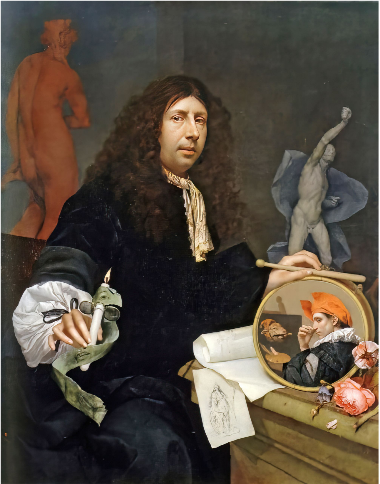
Fig. 12: Jan van Wijkersloot (zugeschr.): Selbstbildnis, 1669. Leipzig, Museum der bildenden Künste

Da weder vom Künstler, einem möglichen ‚Insinuator‘ oder einer anderen zeitgenössischen Stimme zu dem aus einer um 1800 angelegten Privatsammlung stammenden, jetzt in Leipzig befindlichen