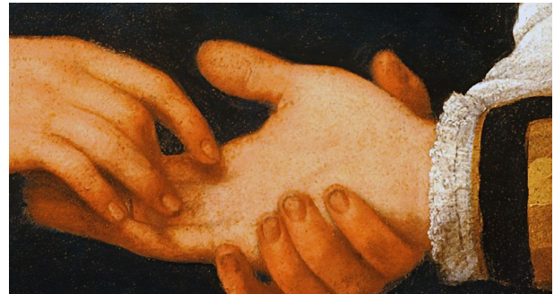
Fig. 7b: Caravaggio: Die Wahrsagerin, um 1595-98, Detail. Rom, Pinacoteca Capitolina

Der Ringraub in beiden Versionen der ‚ Wahrsagerin ‘ (Fig. 7a u. b) von Caravaggio ist nur ein etwas verdeckter Helferschlüssel zum weiteren Verständnis, da bei einer wahrsagenden Zigeunerin schon immer – also ‚unparadox‘ (‚epidox‘?) – der Betrug (vgl. Leonardo: betrügerische Chiromantik) mitschwingt. Übrigens ist dieser defacto bei einem einigermassen passenden Fingerring durch ein einfaches Abstreifen gar nicht so leicht möglich. Ob es unbemerkt bei beiden Varianten gelingt, ist gar nicht gesagt bzw. gezeigt. Im schwächeren späteren römischen Bild scheint der junge Adlige weniger naiv zu sein, sodass er auch gleich sein Schwert zumal gegenüber