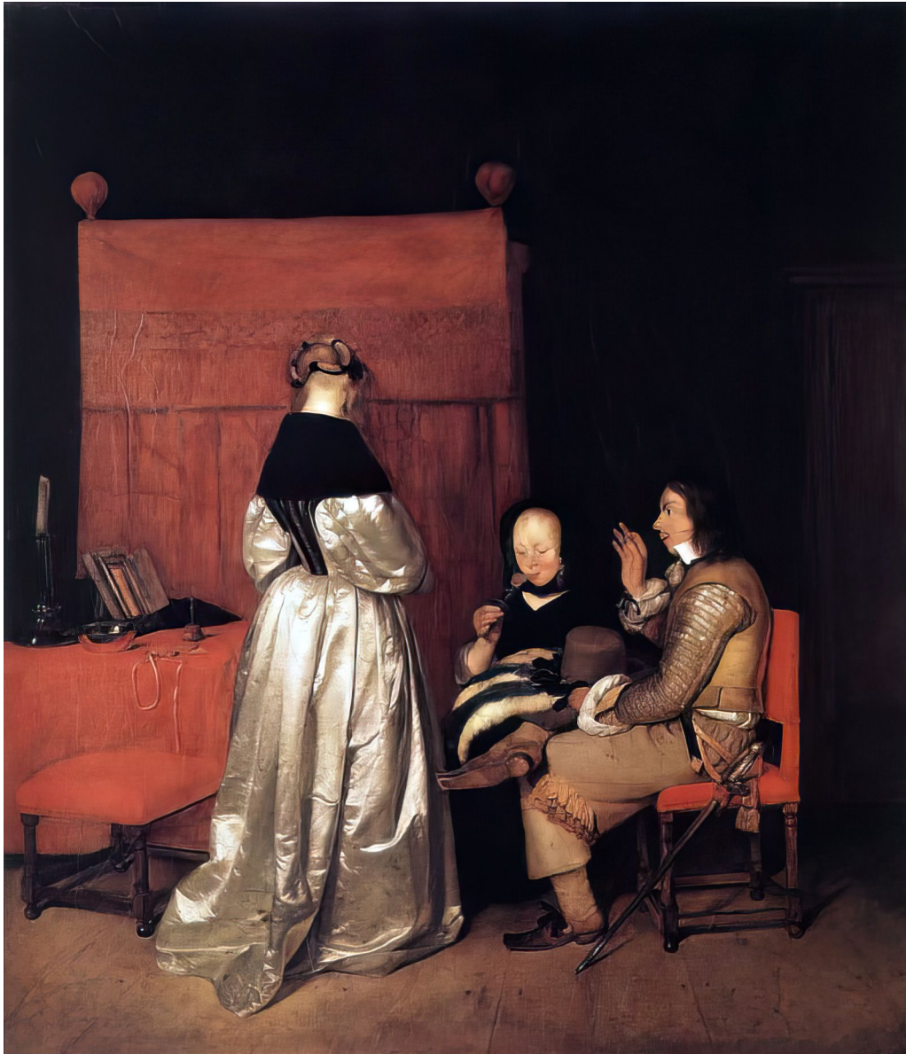
Fig. 10: Gerard ter Borch: Galante Konversation (Der Antrag), 1654/55. Berlin, Gemäldegalerie

mittlerweile zur „Galanten-Konversation“ mutiert ist, da „wahrscheinlich ... ein älterer Mann einer unverheirateten jungen Dame von Stand Avancen mach(e)“ (S. 351). Trotz der Attraktivität des Bildes nicht nur wegen der malerischen Virtuosität in der Stoffwiedergabe gibt oder gab es keine zeitgenössischen Erklärungen des Themas (wegen Selbstverständlichkeit?). Intuitiv würde der Rezensent leicht variiert dem Bild den Titel ‚Der standesgemässe Antrag‘ geben, da ein sicher nicht