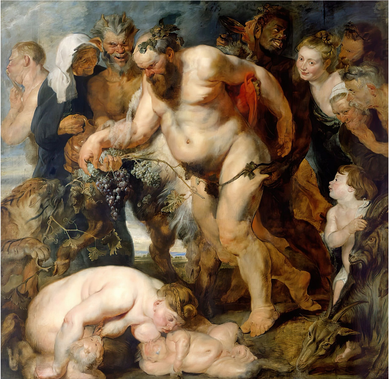
Fig. 8: Peter Paul Rubens: Der trunkene Silen, um 1615 u. um 1625. München, Alte Pinakothek

Im Zentrum des Kapitels steht der Norden und Süden vereinende Peter Paul Rubens neben einem „gut und gerne zweimal hundert Jahre“ als Gesprächsstoff sich eignenden, unserer Meinung nach eher mässigen Gemälde eines massigen, kaum lachenden und zu dem wie eine Witwe trauernden, aber nicht weinenden Heraklit schauenden Demokrit („zwei Wanste im Freien“) dargestellt sind.