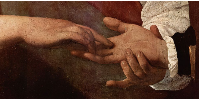
Fig. 7a: Caravaggio: Die Wahrsagerin, um 1595. Detail. Paris, Louvre

Zur „Bivalenz“ (S. 241) bei dem in einer Akademiepose paradox oszillierend auf einem Block sitzenden, lachenden jugendlichen Johannes den Täufer mit einem umhalsten Bock statt Lamm könnte man statt an einen antiken Hirten auch an den biblischen Isaak und seinen Opferersatz denken. In Anm. 118, S. 242/43 wird die allein systemtheoretisch und nicht ästhetisch verstandene „Paradoxie“ (Luhmann) wenigstens partiell kritisiert.