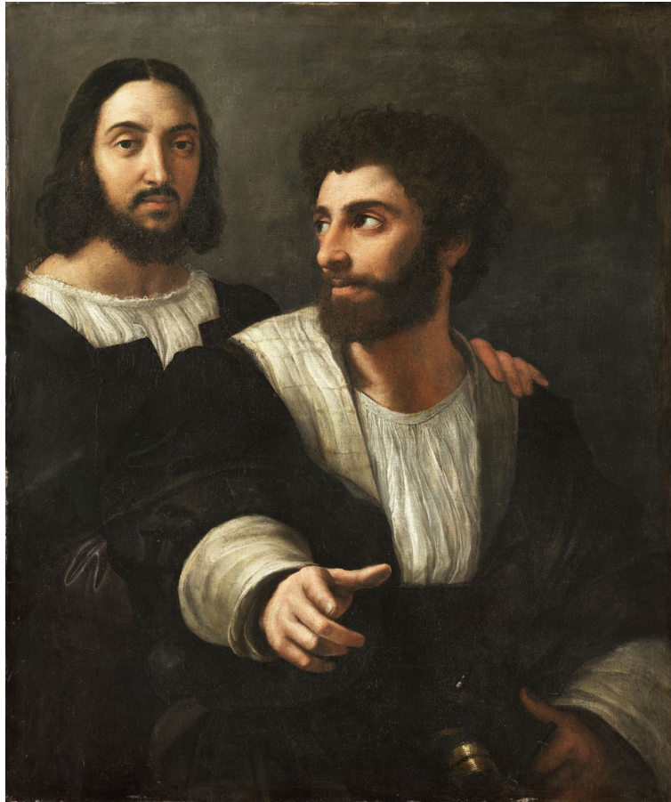
Fig. 6: Raffael: Selbstbildnis mit einem Freund, um 1518-1520. Paris, Musée du Louvre

Letzterer als erst 19- bis 21jähriger fast die aktive Führungsposition durch Handauflage schon einnimmt, eigenartig visionär zur Seite (zu einem unbekanntem dritten Mann?) aber kaum bis ganz nach hinten oder herüber zu Raffael blickt und nur wenig Ähnlichkeit im Vergleich mit einem