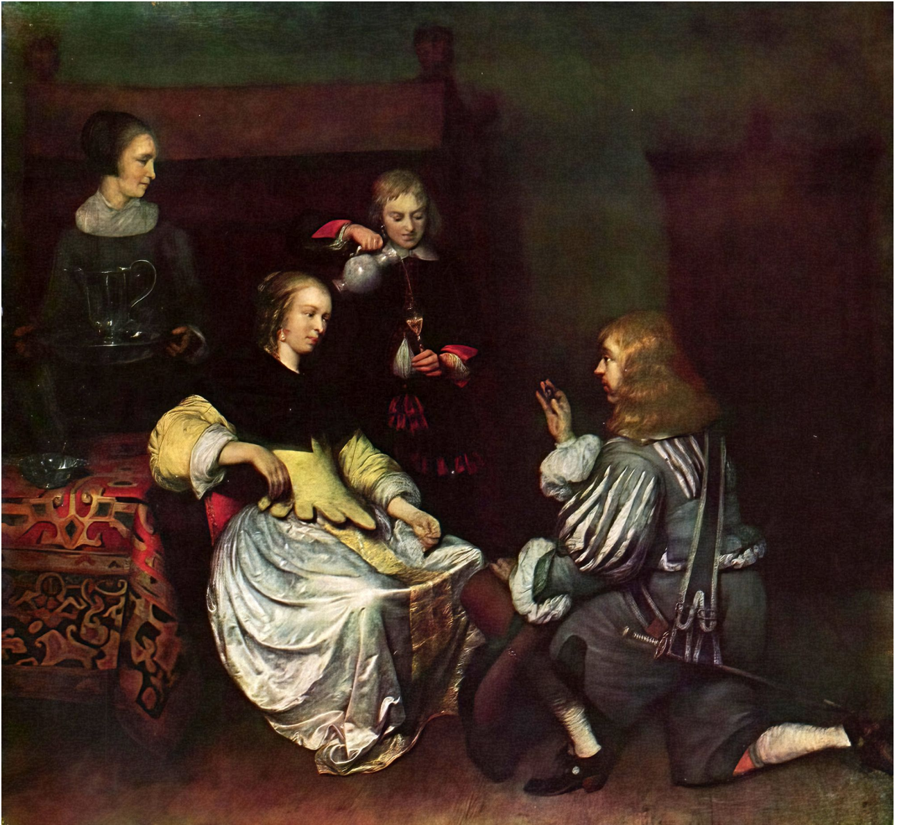
Fig. 11c: Caspar Netscher, Das Medaillon, um 1670. Öl/Lwd. 62 x 68 cm. Budapest, Magyar Szépművészeti Múzeum.

druck eines treuen, nicht eines sexuell scharfen Begleiters (Herr und Hund; wie der Hund, so der Herr?) und trotzdem haben solche Boudoirszenen immer etwas ein ‚G’schmäcke‘. Es liesse sich sicher fast unendlich weiteres physiognomisch noch hinein- oder herausinterpretieren.