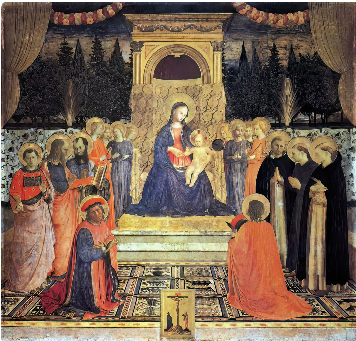
Fig. 2: Fra Angelico: Madonna mit Kind und Heiligen (Pala di San Marco), 1438-1442. Florenz, Museo di San Marco

Weitere konkrete Bildkritik von unserer Seite findet sich zu den folgenden Kapiteln.