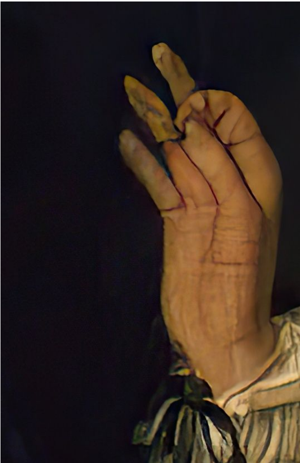
Fig. 11a: Gerard ter Borch: Galante Konversation (Der Antrag), 1654/55, Ausschnitt. Berlin, Gemäldegalerie

Stiefmutter?) zufrieden auf den möglichen Erfolg hin schon ein bisschen ins Glas schaut. In einer Variation des Petit Palais, Paris reicht der dort bürgerliche ‚Freier‘ ihr das Glas, wobei die Auserkorene keine besonders glückliche Miene macht. Zwischen (den mahnenden?) Daumen und Zeigefinger (Fig. 11a u. b) unseres ‚Ehe-Anhalters‘ – ob ‚unter Druck‘ (einer Schwangerschaft) lässt sich von der Rückansicht der stehenden Dame nicht entscheiden – könnte man sich vielleicht einst so etwas wie einen (Verlobungs-)Ring haltend vorstellen – wie bei Caravaggio wäre das dann der ‚clou‘. Nach John Bylwer, Chirologia ... London 1644, Taf. S. 95/96 wären auch Redebeginn („Quibusdem orditur“) oder Zustimmung („Approbabit“) zu vermuten; vgl. auch vom Terborch-Schüler Caspar Netscher, ‚Das Medaillon‘ (Fig. 11c), um 1670, Budapest, Magyar Szépművészeti Múzeum. Die erloschene, leicht schiefe Nacht-Kerze auf dem stereotypen Toilettentisch könnte für eine erloschene Liebe, also wohl keine Liebesheirat stehen; der wie ein Gebetbuch aufgestellte