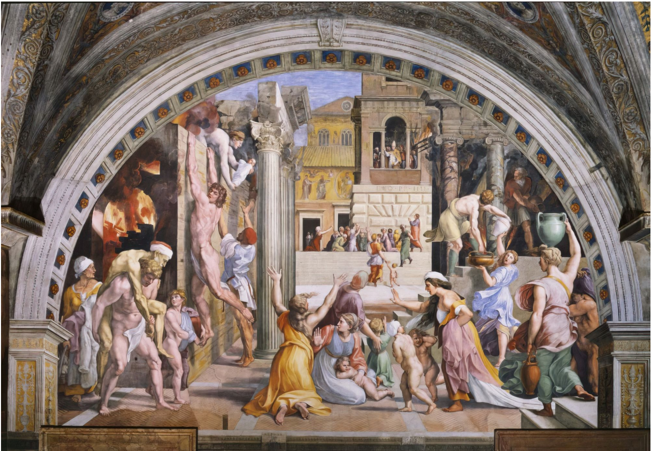
Fig. 4: Raffael: Der Brand in Borgo, 1514. Rom, Vaticanspalast, Stanza dell'Incendio

Rezensent die Michelangelo-Zitate nicht ironisch-parodistisch empfinden, allenfalls selbst-ironisch, da Raffael figürlich nach 1505 ohne Michelangelo nicht zu denken ist, und ihn im ‚Borgo-Brand‘