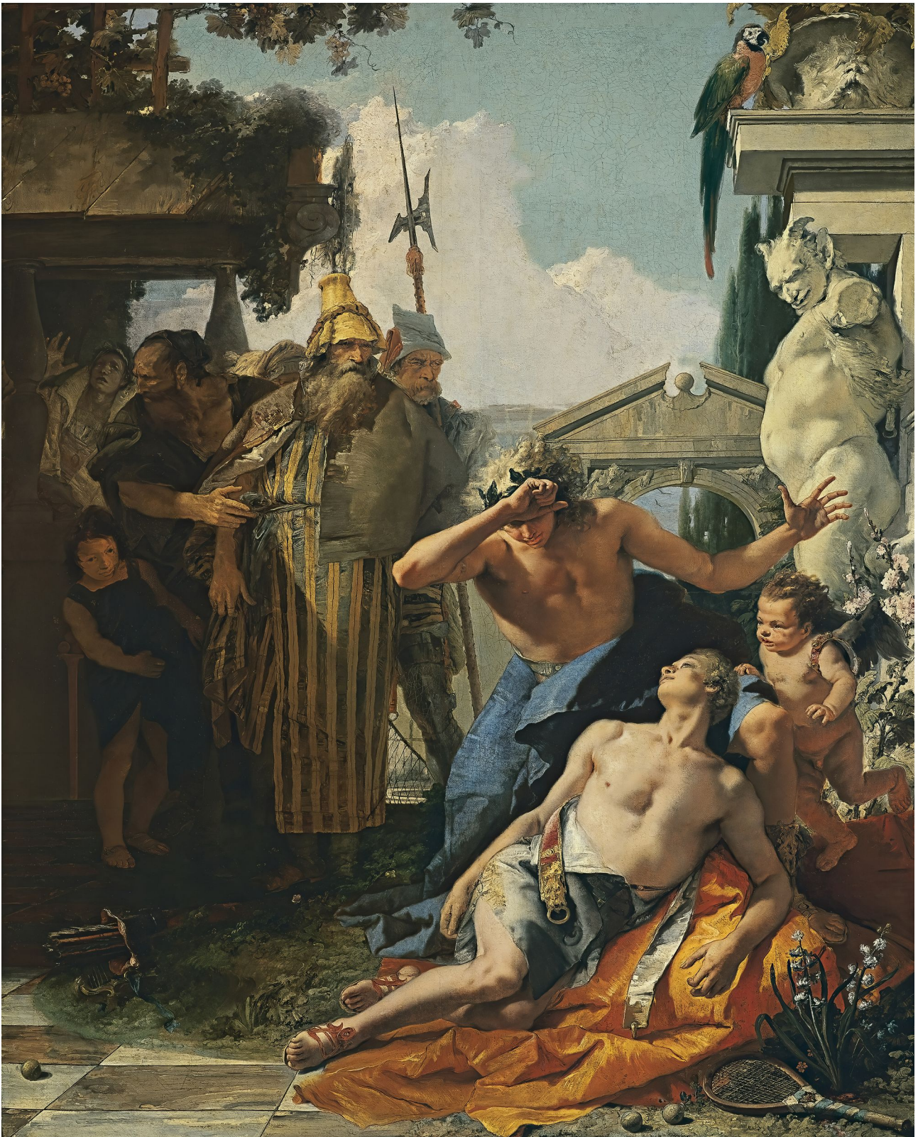
Fig. 15: Giovanni Battista Tiepolo: Der Tod des Hyazinth, 1752/53. Madrid, Museo Thyssen-Bornesmisza

breit geschilderten Ballspiel und dem tödlichen Ball-Treffer ohne Zephyr zur Verwendung gekommen scheint. Der Autor weist aber auf eine von der Forschung bisher anscheinend