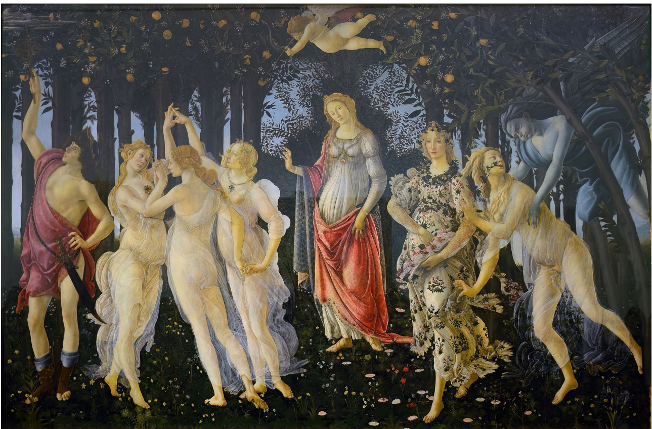
Fig. 3: Sandro Botticelli: Primavera, 1480-1482. Florenz, Uffizien

Der dominikanische Maler und sein Orden haben sicher mit dem Stifter das erzählerische Bildprogramm wie die Cosmas-Damian-Szenen in der Predella gesprächsweise didaktisch entwickelt. Für die damaligen Gläubigen bzw. zum Glauben Zubringenden sind der Altar bzw. seine Tafeln vorschein-paradiesische Schaustücke und kein über die bloße Novität hinausgehendes Programm über Glaubensfragen. Die ganze ‚Sacra Conversazione‘ ist ein gemeinschaftliches stilles Gebet oder Anbetung. Vasari, der etwas verwunderlich Fra Angelico sehr schätzt, erwähnt weder die konservativen Elemente des Malers noch den heute so herausgehobenen Trompe l’oeil -Effekt, ein Kunstgriff, der bei Botticelli (Abb. 29) an Bedeutung sehr verloren hat und immer noch auf die retabellose Zeit zurückweist.