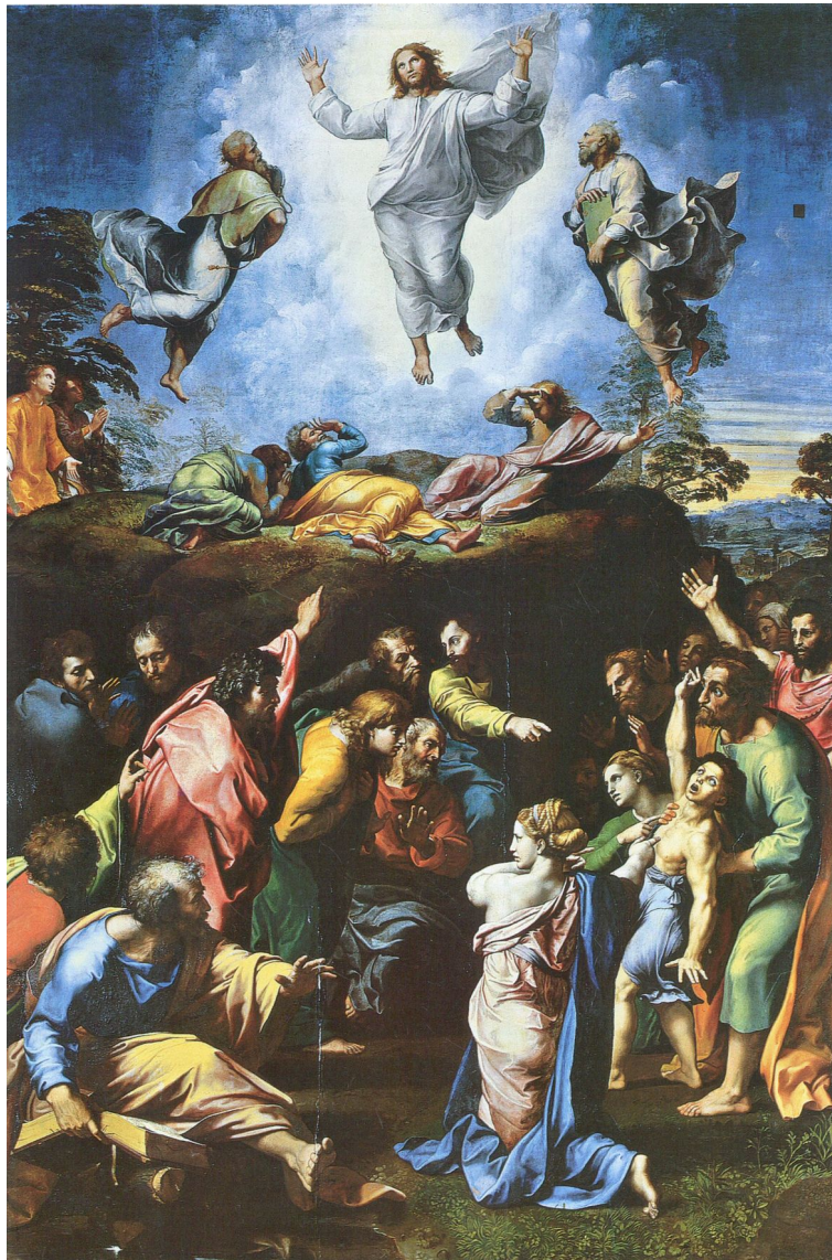
Fig. 5: Raffael: Transfiguration, 1519/20. Rom, Vatikanische Museen

Hand Michelangelos stammen soll, kann der Rezensent wegen der unkörperlichen Auffassung nicht nachvollziehen.